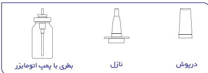
بطری با پمپ اتوماتیزر